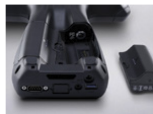
Im Betrieb austauschbare Akkus