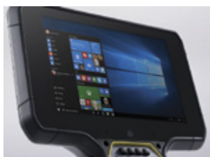
Windows 10 Pro Betriebssystem