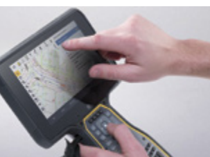
7" Multi-Touch- Bildschirm